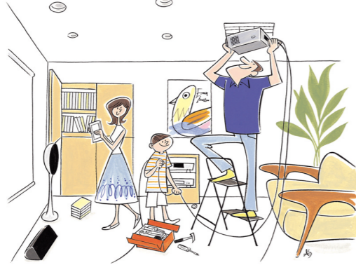
表紙イラスト/ソリマチアキラ

表紙デザイン/大前英史デザイン室 表紙イラスト/ソリマチアキラ 口絵レイアウト/大前英史デザイン室、 PUMPWORKSHOP、G & P、 山縣玲彦、増淵 薫、ハセデザイン 口絵図版、イラスト/山名麗子、 石井健、あんどうななお、インナミリサ、安達三恵