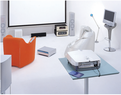
「ハイビジョンスタイル2003」より