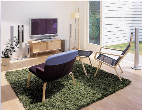
「ホームシアタースタータープラン4」より