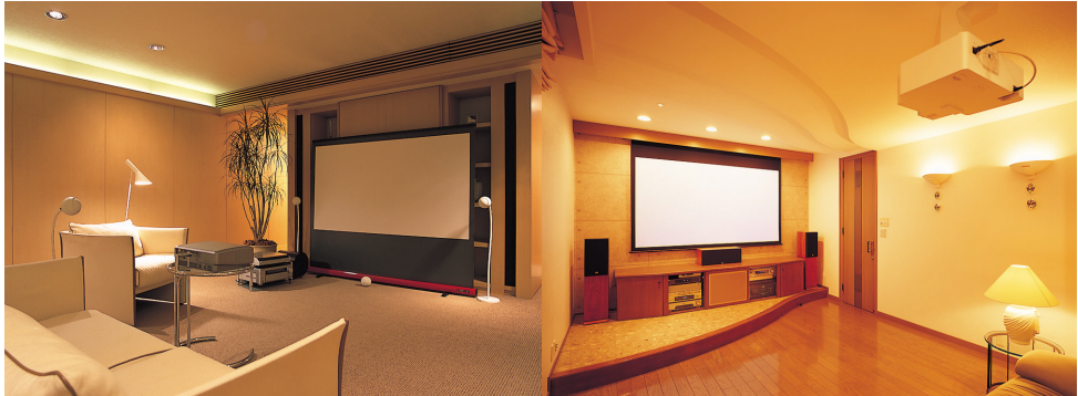
「ホームシアターは大画面からはじめよう!」より