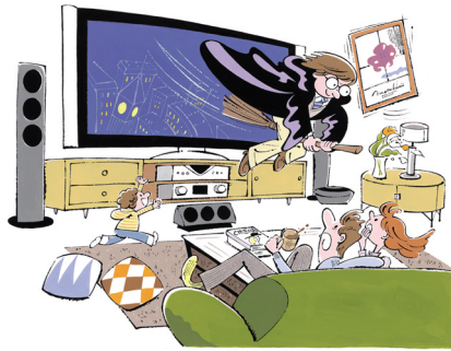
表紙イラスト／ソリマチアキラ

表紙デザイン／大前英史デザイン室 口絵レイアウト／大前英史デザイン室、 ポンプワークショップ、バラレルヴィジョン、 ハセデザイン、G&P、ギョーワ、ゴールデンエイジ 口絵図版、イラスト／山名麗子、石井 健 編集協力／トロヴァドール、渡部由美子、 本山由樹子