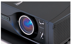
「エントリーハイエンド・プロジェクター徹底研究」より

5人のインストーラーが考える、間取りにマッチしたホームシアタープラン ／ザ・ステレオ屋、ライフスタイル、クリアーサウンドイマイ富山店、デジタルネットワークステーション「ラボ」、AV BOX ／間取り提案・文 角田 充／イラスト 石井 健