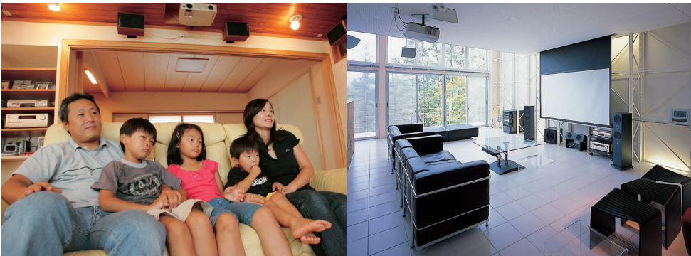
「我が家にホームシアターがやってきた!」より