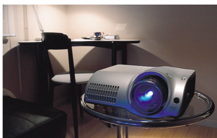
「マンションでホームシアター」より