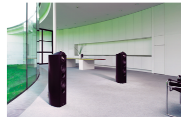
「私たちの新しいオーディオ」より

114 PART 5 家のどこでも音楽を。 家庭内音楽配信ではじめる次世代ミュージックライフ /編集部