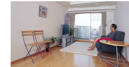
「フロントサラウンド」より