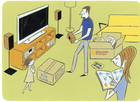
表紙イラスト/ソリマチアキラ

表紙デザイン/大前英史デザイン室 口絵レイアウト/大前英史デザイン室、 ポンプワークショップ、パラレルヴィジョン、 ハセデザイン、G&P、ギョウワ 口絵図版、イラスト/山名麗子、石井 健、 あんどうなおこ、田中たい子