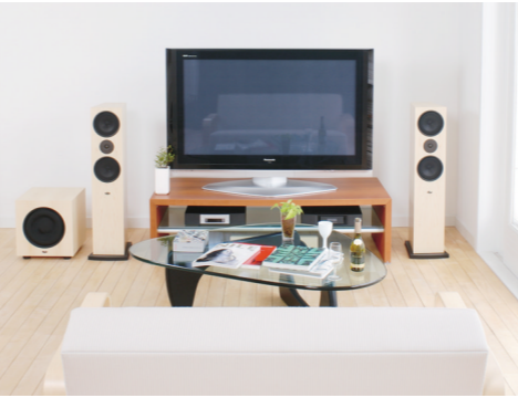
「特集4 薄型ディスプレイで「装う」」より