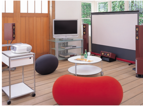
「特集1 ホームシアタースタープラン」より