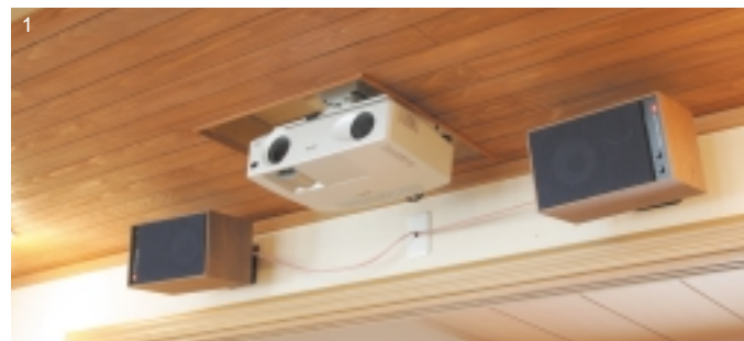
1 プロジェクターは打ち込み角の関係から、天井を少し切り抜いて上げて吊り下げた。それを囲むようにサラウンドバックを壁掛けに。元々リアセンターを付けていたのだが、センタースピーカーを4312Mから4312B Mk IIに変えたため、4312Mが余り、これ幸いと、現在の形へと変化した。2 JBL派の金田さん、サラウンドには4312Mを使用。3 センタースピーカーには4312B Mk IIを使用。フロントスピーカーに合わせた。4 フロントスピーカーはかなり高い位置に設置。スクリーンが大きいので、高めの設置がちょうどいい

ながりを視野に入れて金田さんは住まいづくりに臨んだと話す。そして、リビングシアターも「家族で楽しむホームシアター」として活用されている。 「もともと、家を建てたらホームシアターを作りたい、という考えがありました。それで、せっかくだから家族で楽しめるようなホームシアターを作ろうと思いい、計画を立てていきました。」 金田さんのそんな思惑とあり、リビングシアターは家族のものとして使われている。「子供たちはテレビ番組だっけスクリーンで見たがるんです。半ば子供たちに乗っ取られたようなものです」と笑つ。 シアターの中核を担うプロジエクターが、購入後1年余りにもかかわらず、既に600時間も稼働しているという事実が、このリビングシアターの幸せを象徴しているといえるだろう。