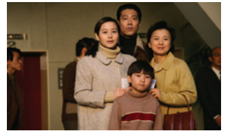
ALWAYS 続・三丁目の夕日 ©2007「ALWAYS 続・三丁目の夕日」製作委員会